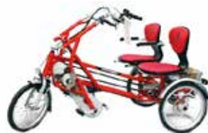
Vélo tandem à assistance électrique