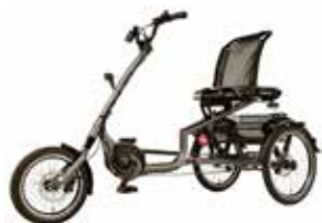
Vélo tricycle à assistance électrique

Venez tester le vélo qui vous correspond :