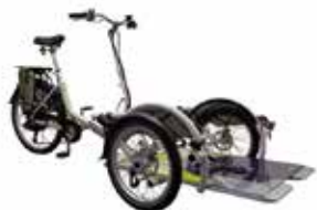
Vélo triporteur pour fauteuil roulant à assistance électrique